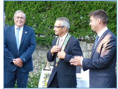
2012-2013 – Chibois