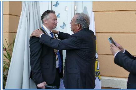
Casino de Grasse